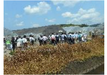
見学の様子。たくさんの関係者が見に来られました。

京都府が取り組んでいる農業と福祉の連携事業。そのモデルとして志高に京都府・農業・福祉の関係者の方々が見学に来られました。 ちょうど発送の作業中で、箱作り・苗入れ・伝票入れ・ふた閉めなどそれぞれの作業に責任を持っている皆さんの様子を見て、感心しておられたそうです。